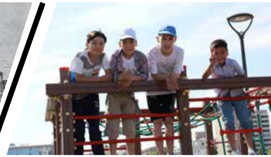
“Kids university” жазғы лагери қайта ашылып, балаларды қуантты – 8 бет