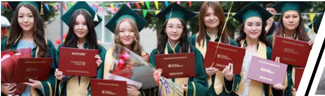
«Ақ жол саған, жас түлек!» Университетте диплом тапсыру салтанатты шарасы өтті – 4-6 беттерде